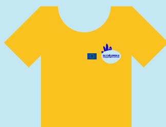
Eiropas Komisija, kuru pārstāv Tiesiskuma un patērētāju ģenerāldirektorāta komanda