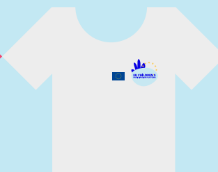
Pieaugušajiem, kuri šeit ir kopā ar bērniem