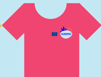
Odborníci na bezpečnost