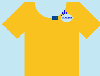
Ευρωπαϊκή Επιτροπή, εκπροσωπούμενη από την ομάδα της Γενικής Διεύθυνσης Δικαιοσύνης και Καταναλωτών Ομάδα της πλατφόρμας της ΕΕ για τη συμμετοχή των παιδιών