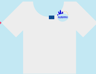
Οι ενήλικες που συνοδεύουν παιδιά