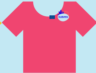
Οι ειδικοί σε θέματα ασφάλειας