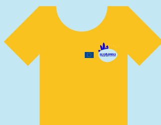
Europska komisija, koju predstavlja tim Glavne uprave za pravosuđe i zaštitu potrošača