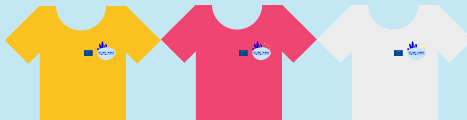
Europese Commissie, vertegenwoordigd door het team van het directoraat-generaal Justitie en Consumentenzaken