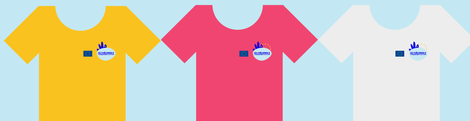
Comisia Europeană, reprezentată de echipa Direcției Generale Justiție și Consumatori