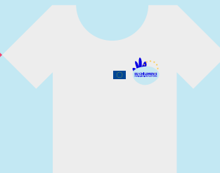
Vuxna som följer med barnen